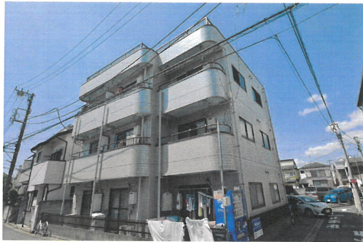
【東武伊勢崎線 竹ノ塚駅 徒歩13分】