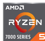
AMD Ryzen™ 5 プロセッサ