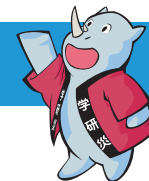
学研災キャラクタースイちゃん

拝啓 時下益々清祥のこととお慶び申し上げます。この度、お子様の合格を心よりお祝い申し上げます。