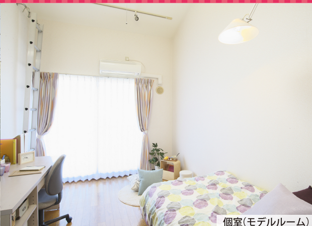
個室(モデルルーム)