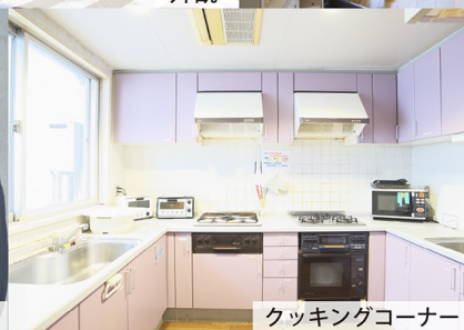
クッキングコーナー